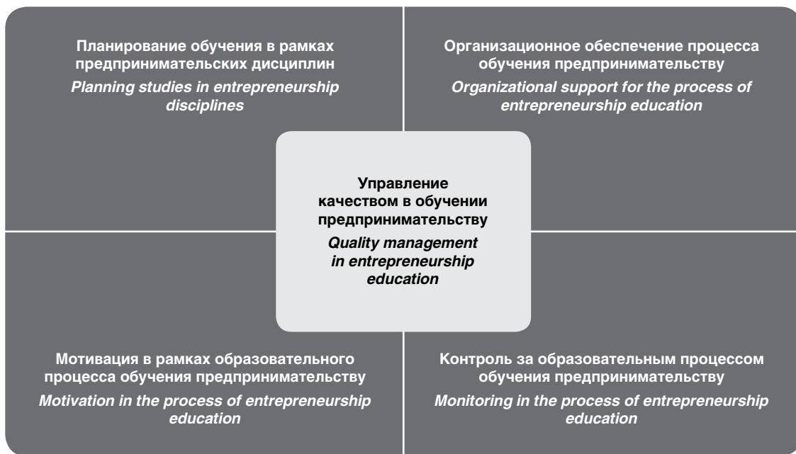
Рис. 1. Мультиинструментальный подход к управлению качеством обучения предпринимательству при обеспечении социальной ответственности вуза